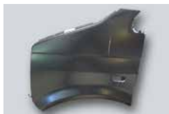
Volkswagen Originálne diely®