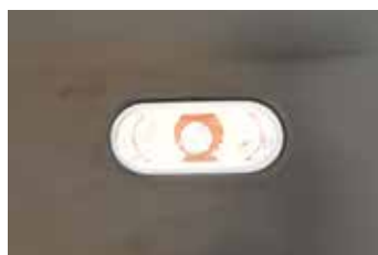
Volkswagen Originálne diely®