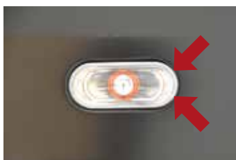
Tong Yang Group

Pre trvácnosť, rozmerovú stabilitu a presnosť montáže si vyberte Originálne diely.